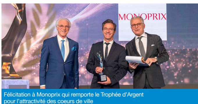
Félicitation à Monoprix qui remporte le Trophée d'Argent pour l'attractivité des coeurs de ville