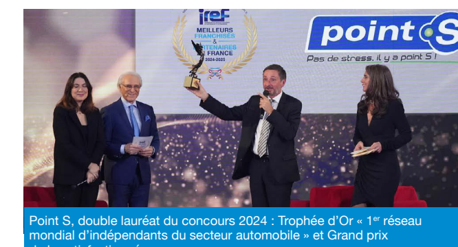
Point S, double lauréat du concours 2024 : Trophée d'Or « 1 er réseau mondial d'indépendants du secteur automobile » et Grand prix de la satisfaction réseau.