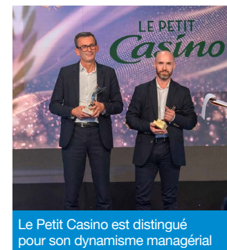
Le Petit Casino est distingué pour son dynamisme managérial