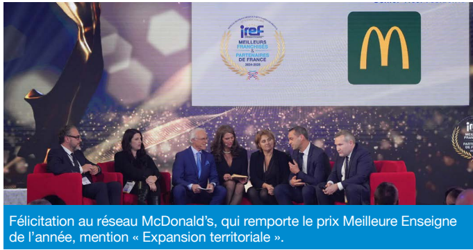
Félicitation au réseau McDonald's, qui remporte le prix Meilleure Enseigne de l'année, mention « Expansion territoriale ».