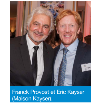
Franck Provost et Eric Kayser (Maison Kayser).