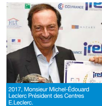
2017, Monsieur Michel-Edouard Leclerc Président des Centres E.Leclerc.