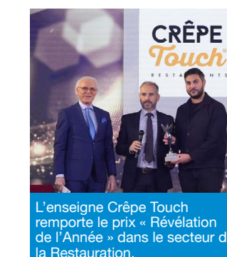
L'enseigne Crêpe Touch remporte le prix « Révélation de l'Année » dans le secteur de la Restauration.