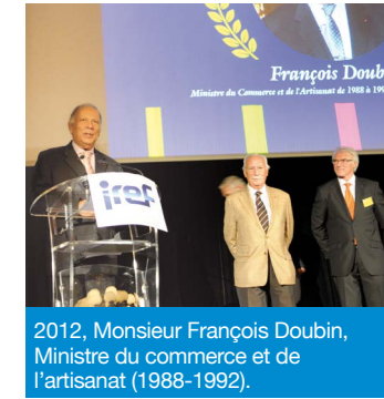
2012, Monsieur François Doubin, Ministre du commerce et de l'artisanat (1988-1992).