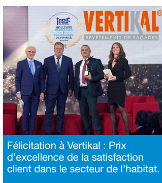
Félicitation à Vertikal : Prix d'excellence de la satisfaction client dans le secteur de l'habitat.