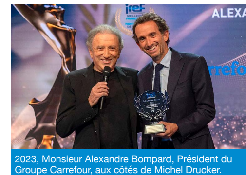
2023, Monsieur Alexandre Bompard, Président du Groupe Carrefour, aux côtés de Michel Drucker.