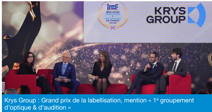
Krys Group : Grand prix de la labellisation, mention « 1 er groupement d'optique & d'audition »