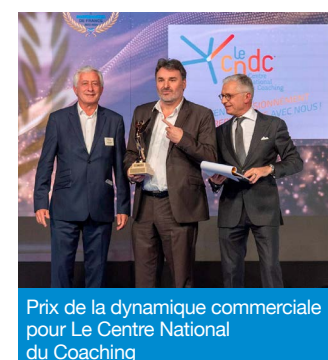
Prix de la dynamique commerciale pour Le Centre National du Coaching