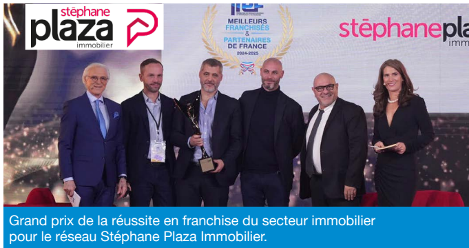
Grand prix de la réussite en franchise du secteur immobilier pour le réseau Stéphane Plaza Immobilier.